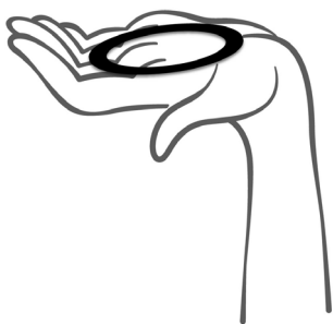
Figura 1 Retirar o anel da saqueta

7. O anel utilizado deve voltar a ser colocado na respetiva saqueta e deitado fora juntamente com os lixos domésticos. Não deite Anette na sanita.